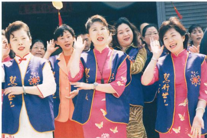
慧行大合唱團身著亮麗的荷花旗袍熱情演出，更為整個開幕儀式增色許多。

靜、安以後，你能進一步考慮嗎？你考慮出了什麼、你研究出了什麼心得？如果沒有順著戒、定、慧這一條軌道痕跡，進入絕對的信受奉行，也就是因戒而生定、因定而發慧的話，你的智慧註定是有限的；