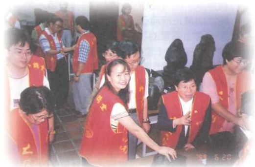
● 義賣大會之前，同修們穿梭於雅石會場上，挑選各自喜愛的雅石。