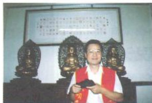
● 慧羽師兄捐出義賣，慧炯師兄以1,200元贊助得標。