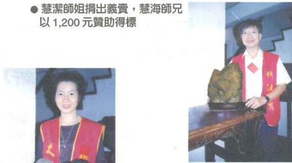
● 慧潔師姐捐出義賣，慧海師兄以1,200元贊助得標。