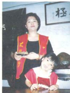
● 慧居師兄捐出義賣，慧許師姐以1,200元贊助得標。