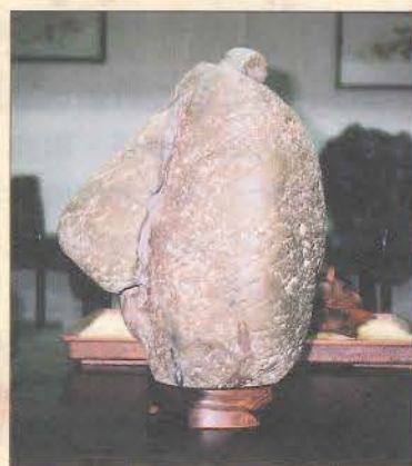
石銘：布袋和尚 石種：八里石心 （即品石之雅石）