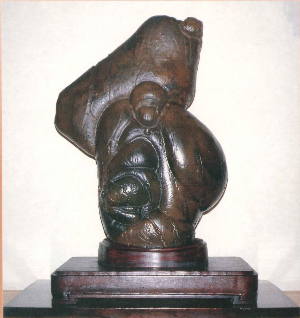
▲來賓石（豐收）75×50×25cm 李明翰 藏

雅石評審之芻議 花東海岸的具化玉 尋幽訪石 室內觀賞石之分類 落實會務、推廣石藝 人人愛石、人人賞石 第三屆中國賞石展覽 96年徐州展 台灣撿石百線千站 第73線花蓮縣木瓜溪