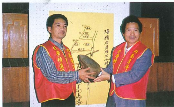
▼ 任重道遠，一步一腳印，往前邁進